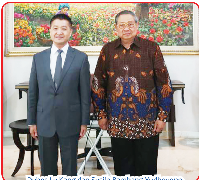
Dubes Lu Kang dan Susilo Bambang Yudhoyono.

JAKARTA (IM) - Dubes Tiongkok untuk Indonesia Lu Kang Rabu (6/4) lalu melakukan audiensi dengan mantan Presiden RI sekaligus Ketua Majelis Tinggi Partai Demokrat Susilo Bambang Yudhoyono (SBY) dan Ketua Umum Partai Demokrat Agus Harimurti Yudhoyono (AHY). Pada kesempatan tersebut, kedua belah pihak bertukar pandangan tentang peningkatan hubungan bilateral, interaksi dan kerjasama antar partai serta membahas berbagai isu internasional dan regional yang menjadi perhatian bersama. • idn/din