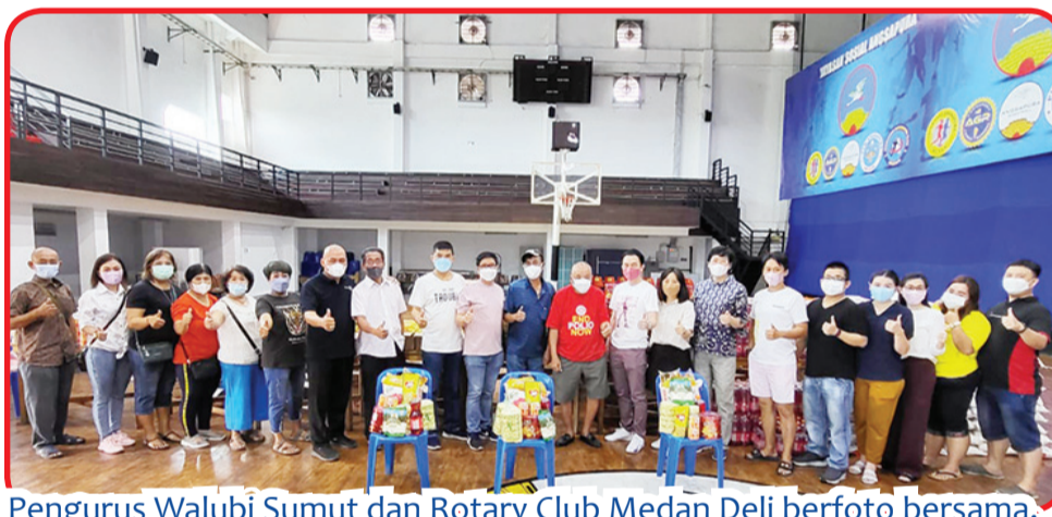
Pengurus Walubi Sumut dan Rotary Club Medan Deli berfoto bersama.

Paket yang dibagikan terdiri dari beras, minyak goreng, kecap, susu kental manis, yifu mie, gula pasir, biskuit, minuman ringan dan lainnya. • idn/din