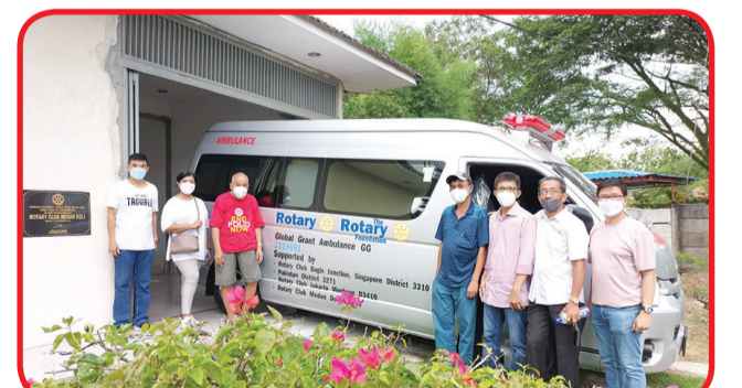
Pengurus Walubi Sumut dan Rotary Club Medan Deli berfoto bersama.