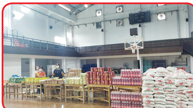
Paket sembako yang dibagikan di GOR Yasora.