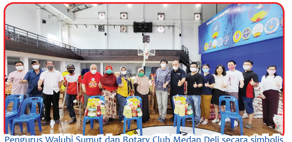
Pengurus Walubi Sumut dan Rotary Club Medan Deli secara simbolis menyerahkan paket sembako ke warga.