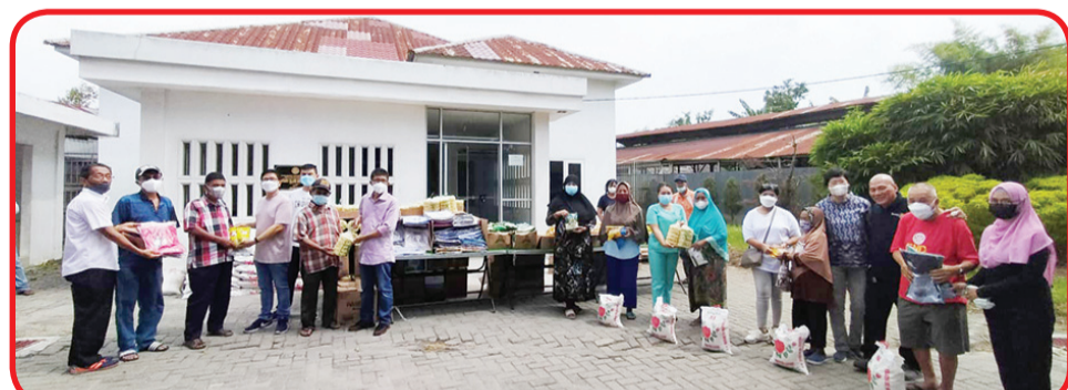
Pengurus Walubi Sumut dan Rotary Club Medan Deli secara simbolis menyerahkan paket sembako ke warga kurang mampu di depan Klinik Rotary Club Medan Deli.